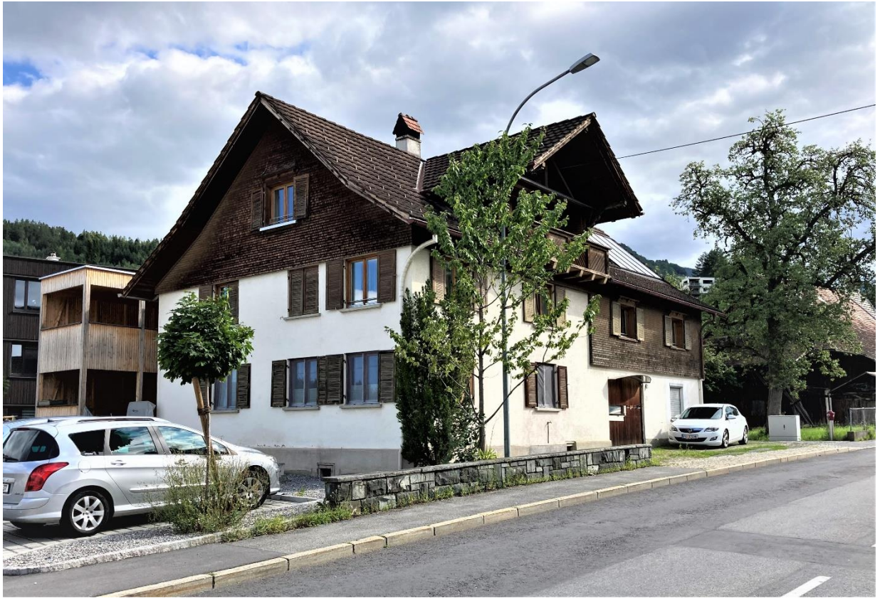
Solides Mehrfamilienhaus in Röthis